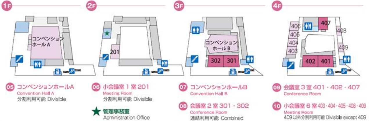
収容数一覧 Number of accommodated List