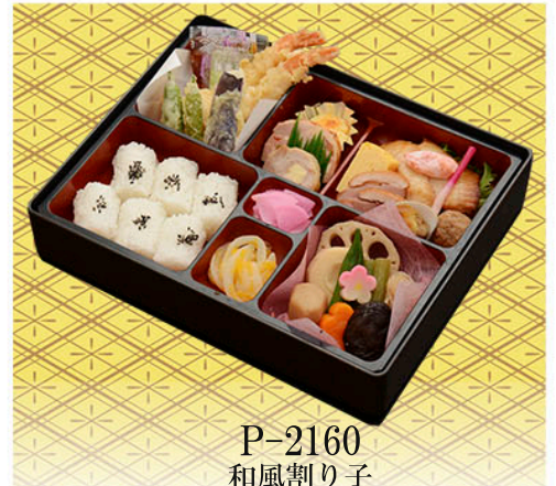
P-2160 和風割り子 蘭(らん)