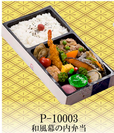
P-10003 和風幕の内弁当 山百合(やまゆり)