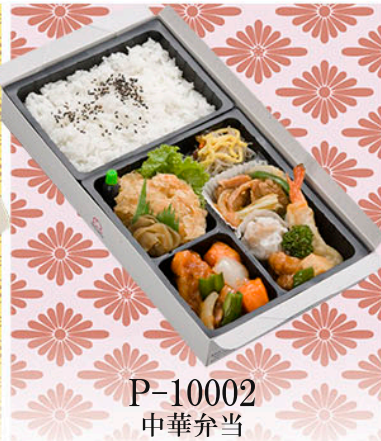
P-10002 中華弁当 花明(かめい)