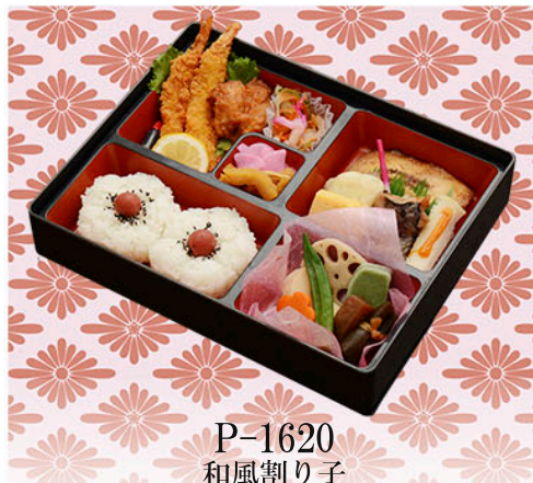
P-1620 和風割り子 薔薇(ばら)