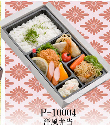
P-10004 洋風弁当 カメラア