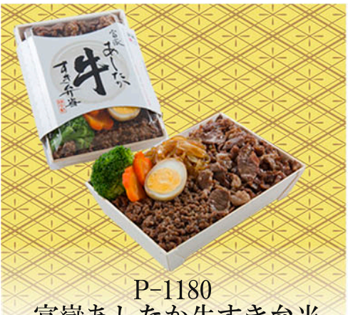
P-1180 富嶽あしたか牛すき弁当