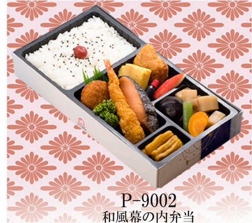
P-9002 和風幕の内弁当 菜の花 (なののはな)