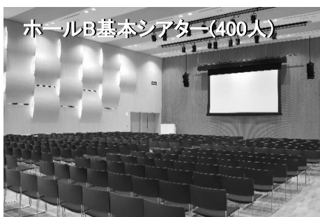
ホールB基本シアター(400人)