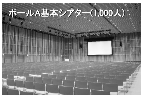
ホールA基本シアター(1,000人)