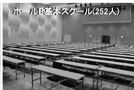
ホールB基本スクール(252人)